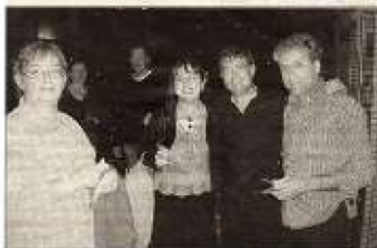
Après le spectacle, les auditeurs ont pu bavarder tranquillement avec les deux artistes.