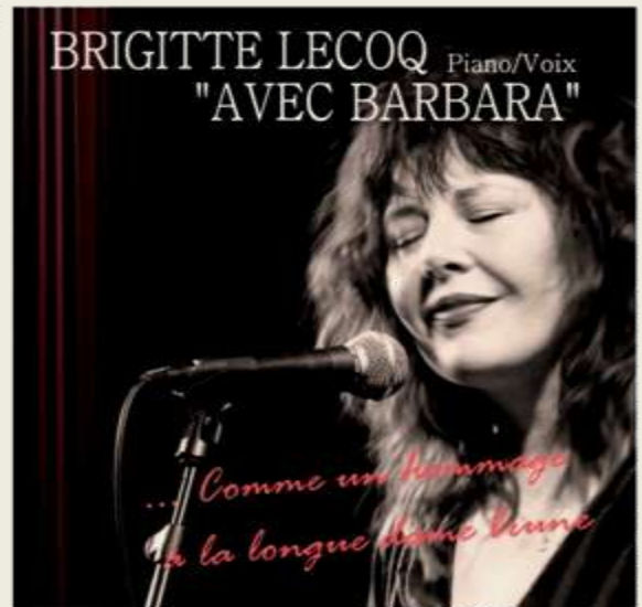
BRIGITTE LECOQ « AVEC BARBARA »