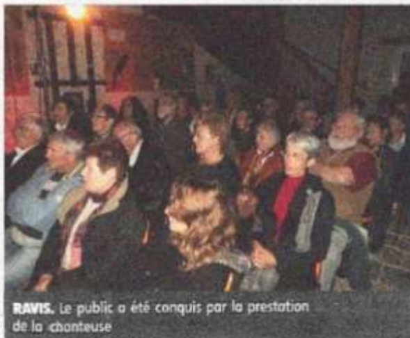
RAVIS. Le public a été conquis par la prestation de la chanteuse.

Dans ce lieu insolite, elle a offert au public un récital d'une grande qualité au travers de chansons retraçant l'histoire de la célèbre diva. Passant avec une voix limpide, de la solitude à la mélancolie, de la sensualité à la légèreté avec une présence envoûtante, voire bouleversante